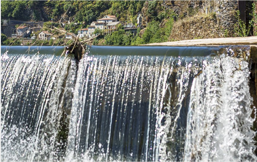
Ambialet 2