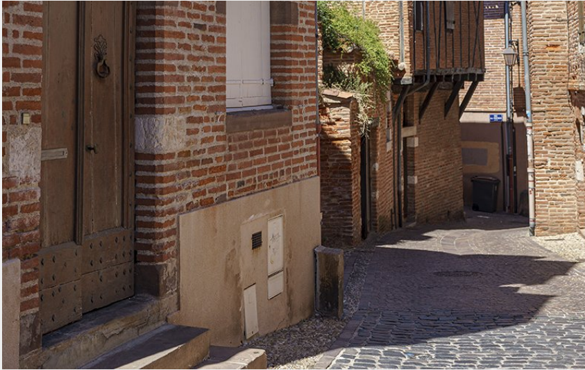
Albi Sainte-Cécile