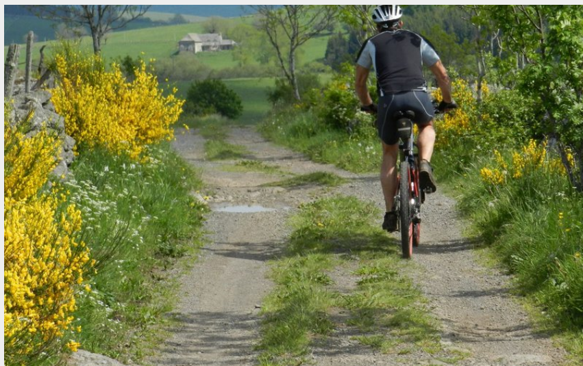
le petit tour du Bouyssou (Tourisme en Aubrac)