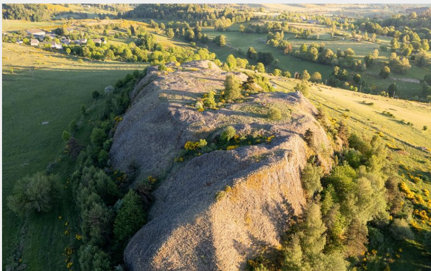
Truc du Cheylaret