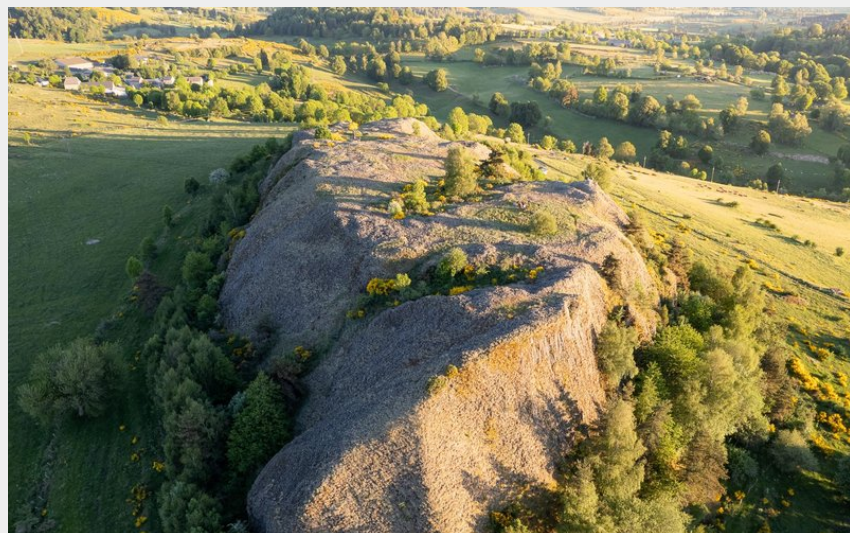
Truc du Cheylaret