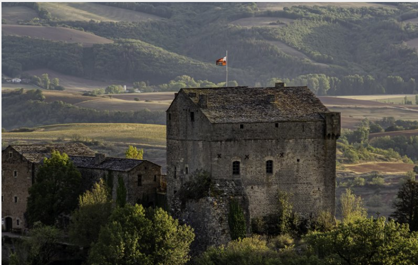
Vue sur le Chateau de Montaigut (Théo Bertrand)