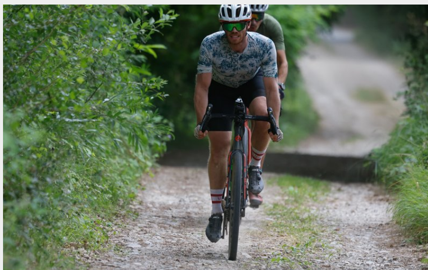
Piste longeant la Dourbie