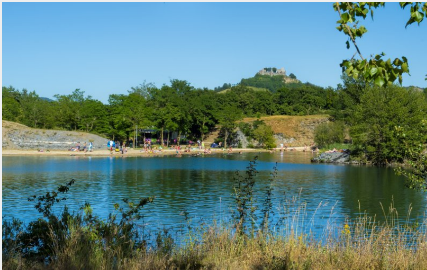
Plage de la Cisba (Florent Deltort)