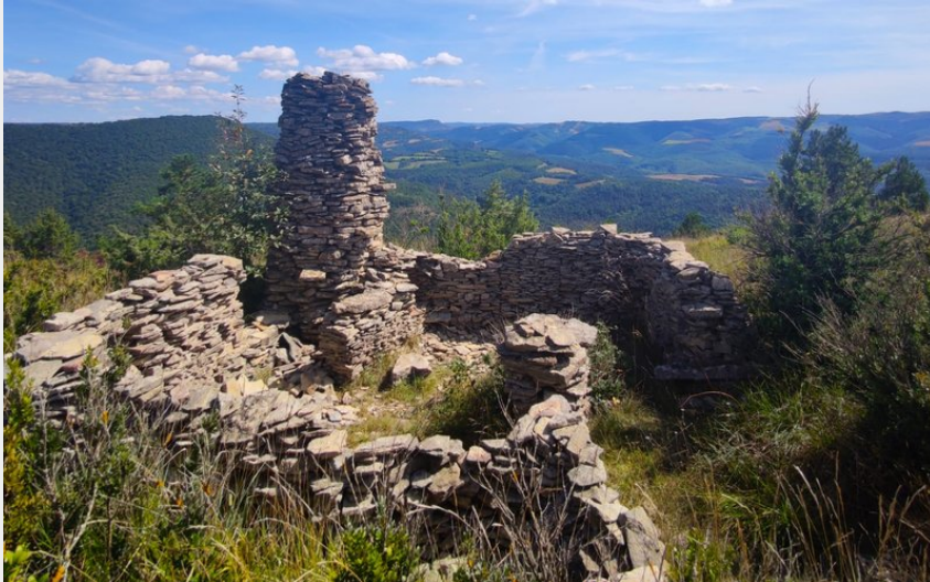
Crêtes et buissière du plateau de Mascourbe