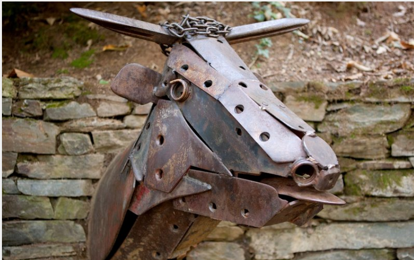
Scultures en fer forgé