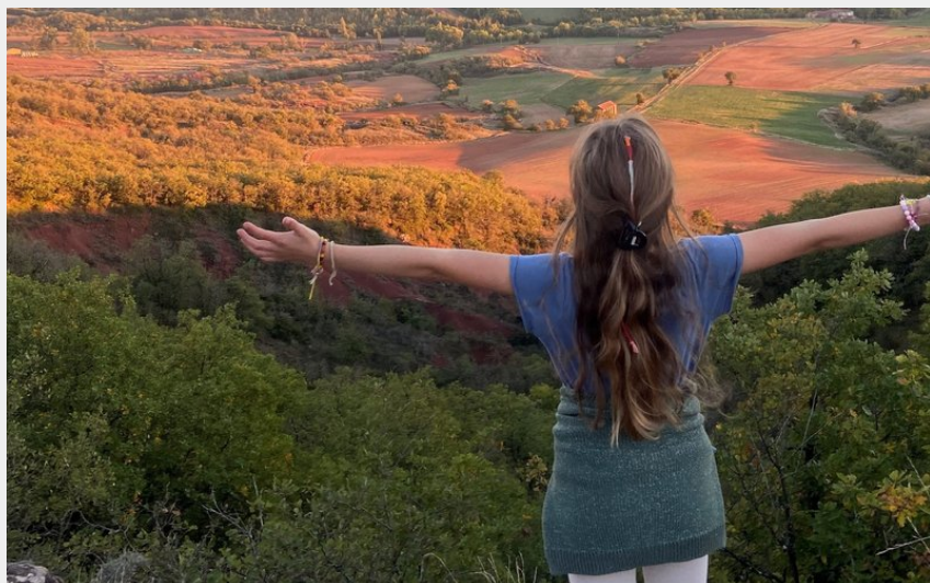
Le balcon (E.Genty)