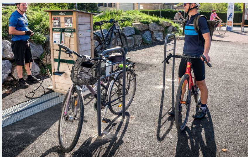
Station service vélos (Virginie Govignon)