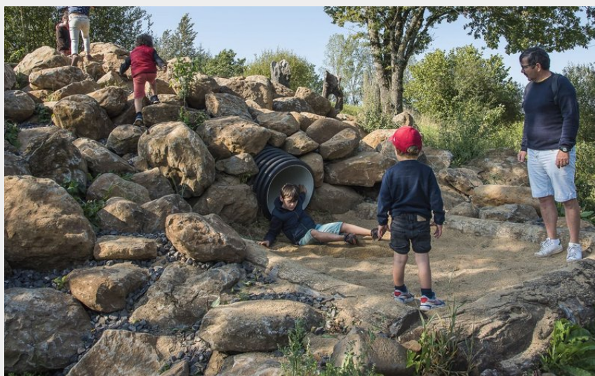
Le toboggan de Binocle