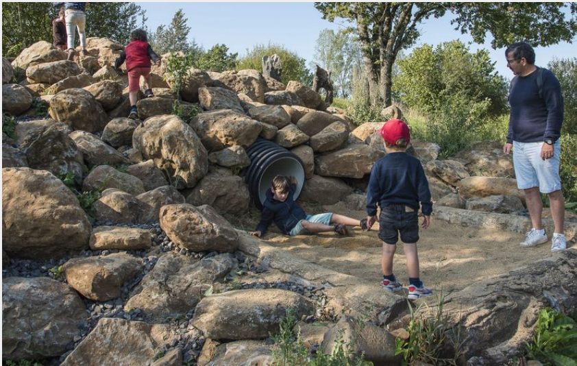
Le toboggan de Binocle