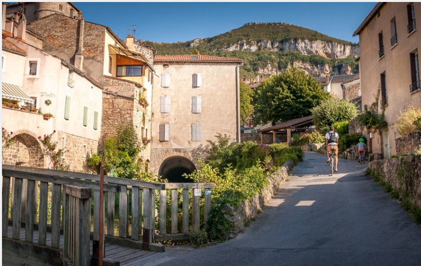
Ancien village de Creissels