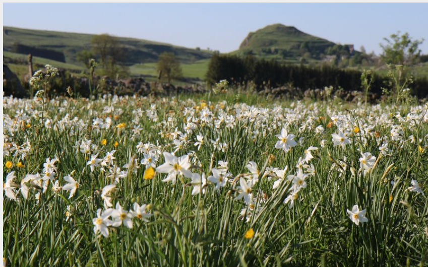
La motte de Marchastel