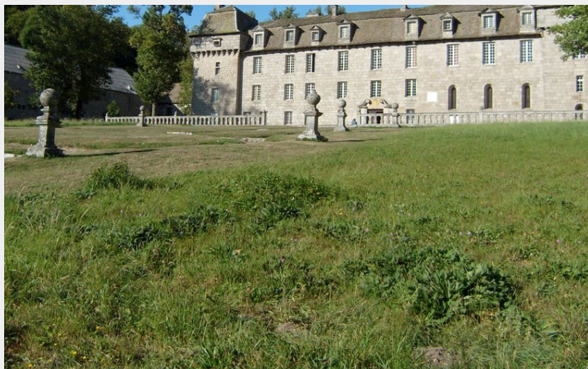
Château de la Baume