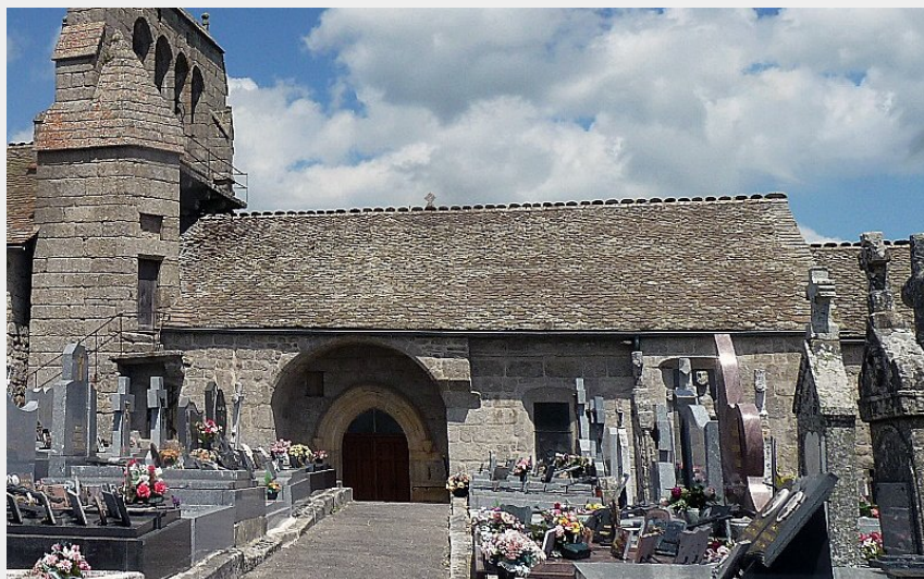
Eglise de la Fage Montivernoux