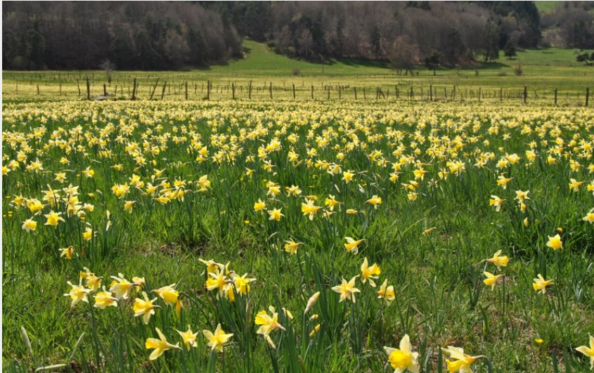
Champs de Jonquilles vers Bécus