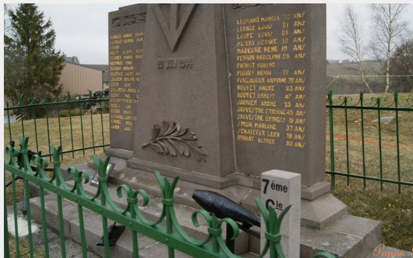
Monument aux morts de la Résistance