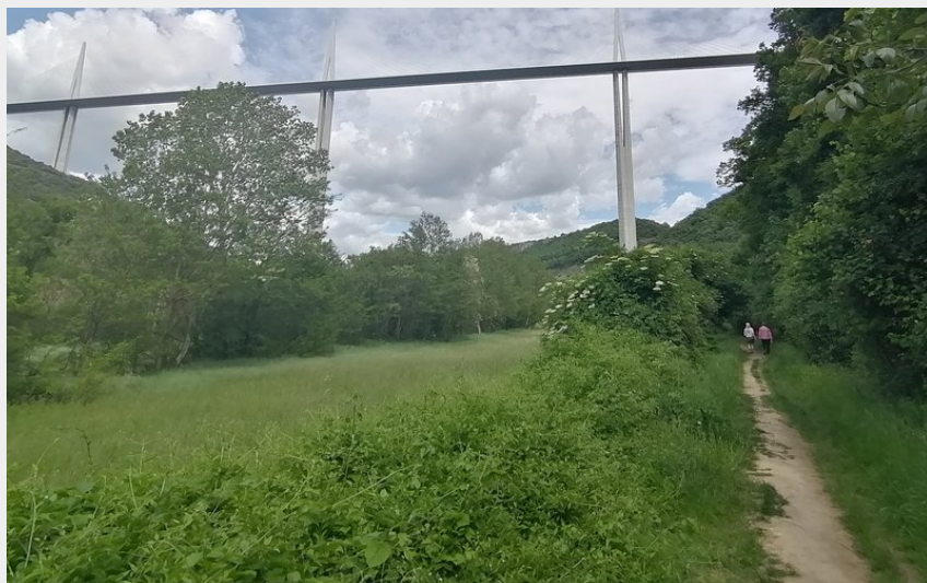
Cheminement doux le long du Tarn