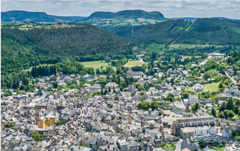
Marvejols vu d'en haut