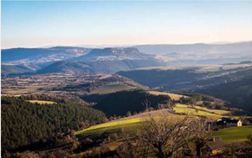
Sur les hauteurs de Marvejols