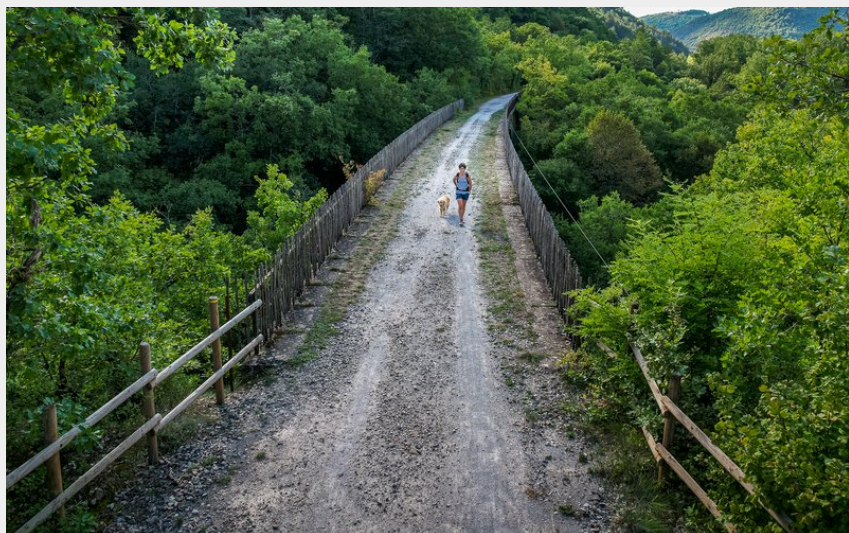
Voie verte (Virginie Govignon)