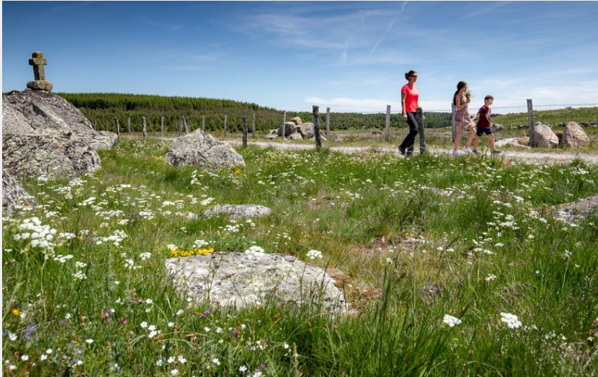
Un chemin de randonnée borné de fleurs