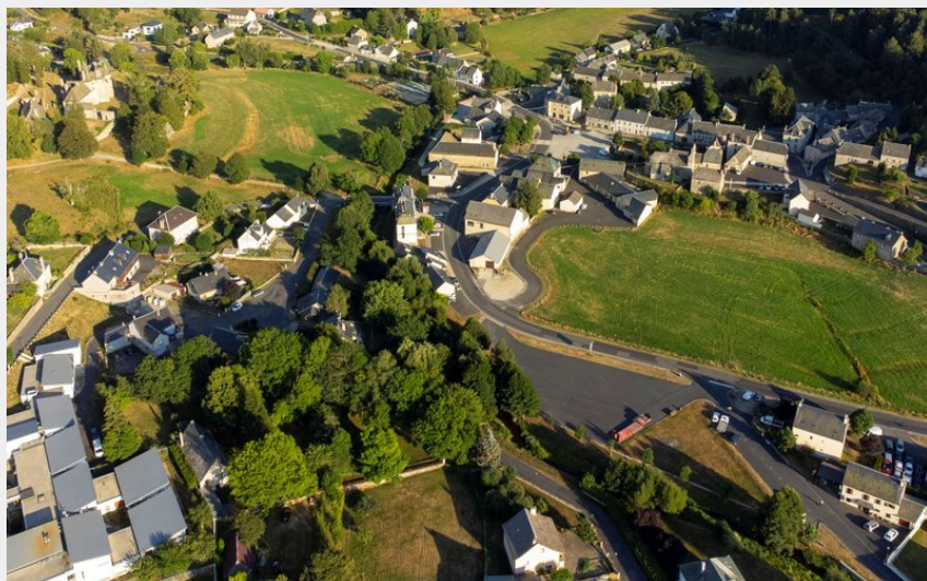
Le village de Fournels