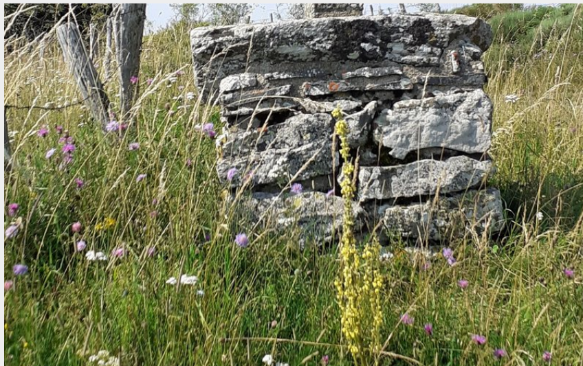
La croix du Cayre