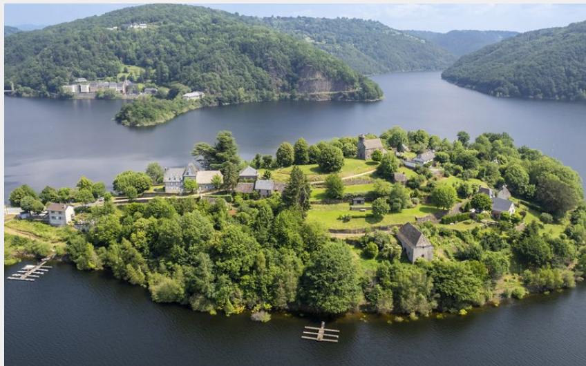
La Presqu'île flottant sur le lac de Sarrans