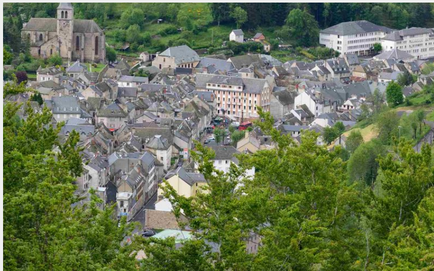
Chaudes-Aigues, cité thermale nichée dans l'Aubrac