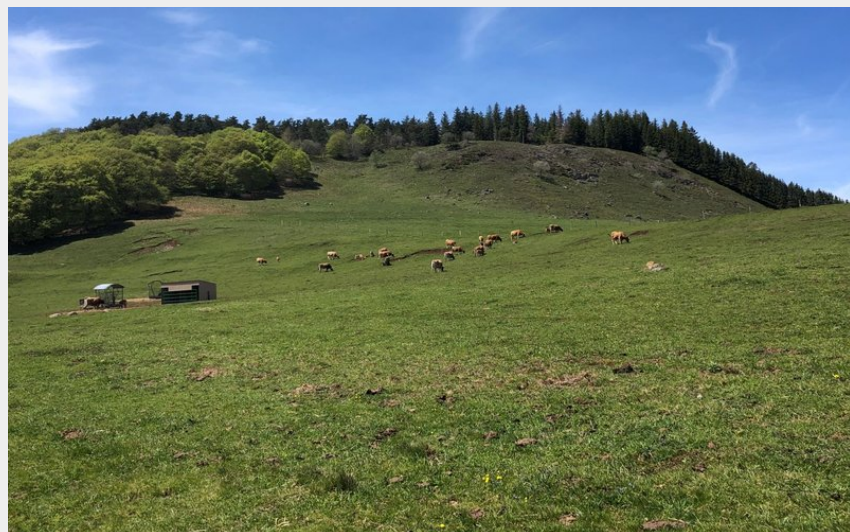
Les estives aux abords de la forêt