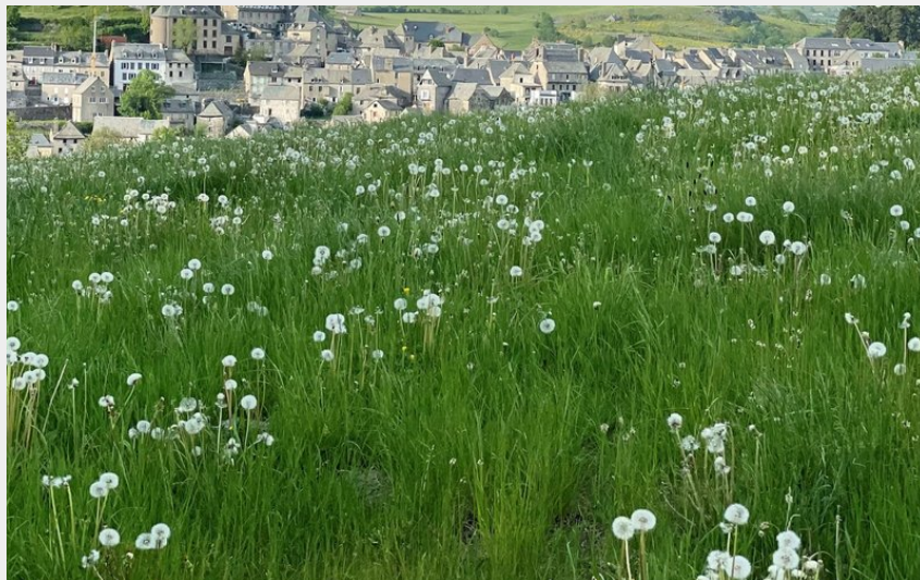
Vue sur Laguiole depuis le Puech