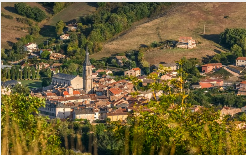
Vabres l'Abbaye (Virginie Govignon)