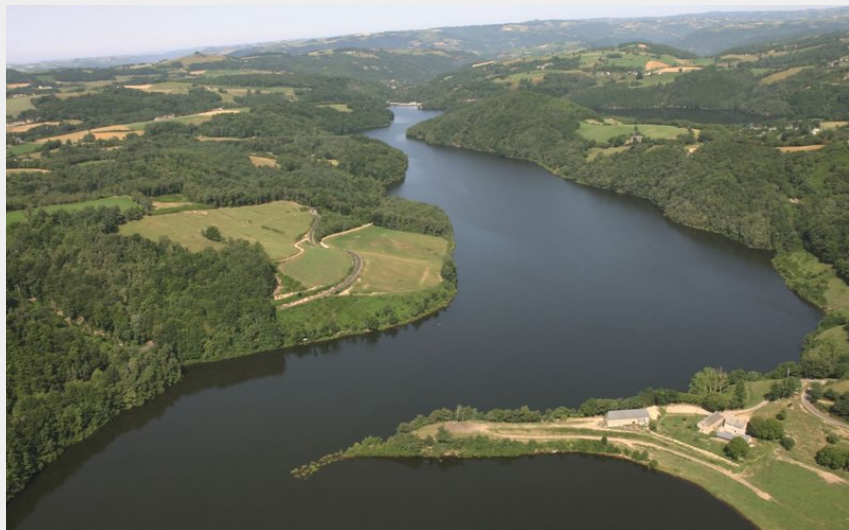
Vue aérienne lac de Maury