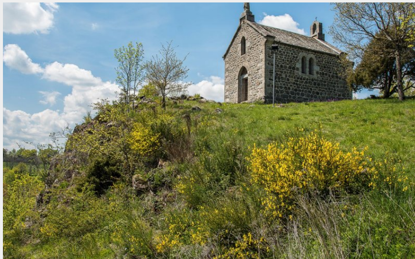
La chapelle du Roc