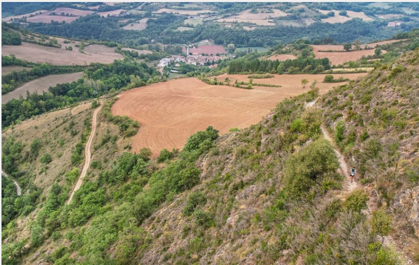
Vue sur Versols depuis le chemin des vignes (Virginie Govignon)