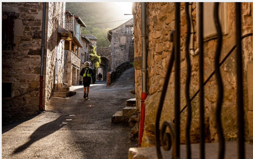
Ruelles de Versols (Fest'Trail Causse & Rougier - Xavier Waerzeguers)