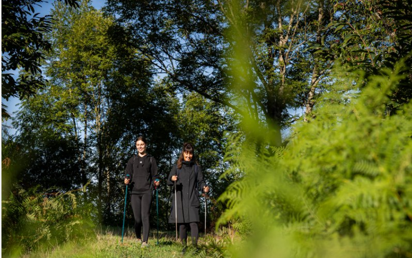
En direction du Suc d'Armont (Xavier Waerzeggers)