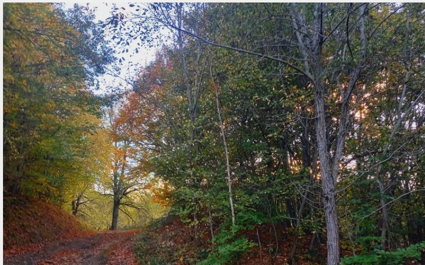
Le Gros Hêtre