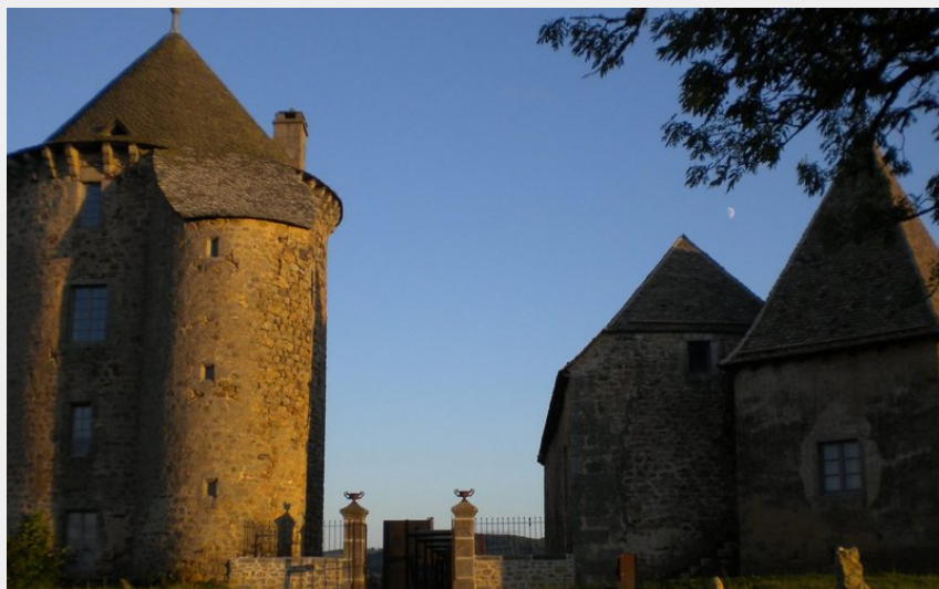
Le château du Couffour au coucher du soleil