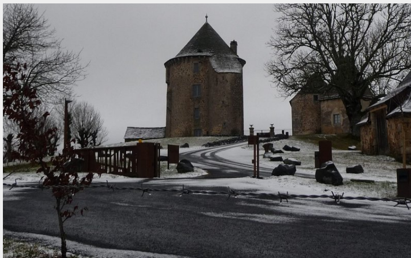
Le château du Couffour habillé de neige