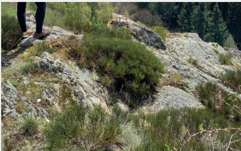
Point du vue sur le Bès