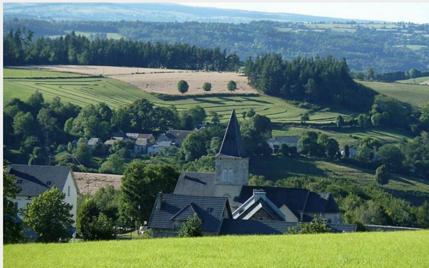
Le village de Saint-Martial bercé d'une lumière de fin de journée