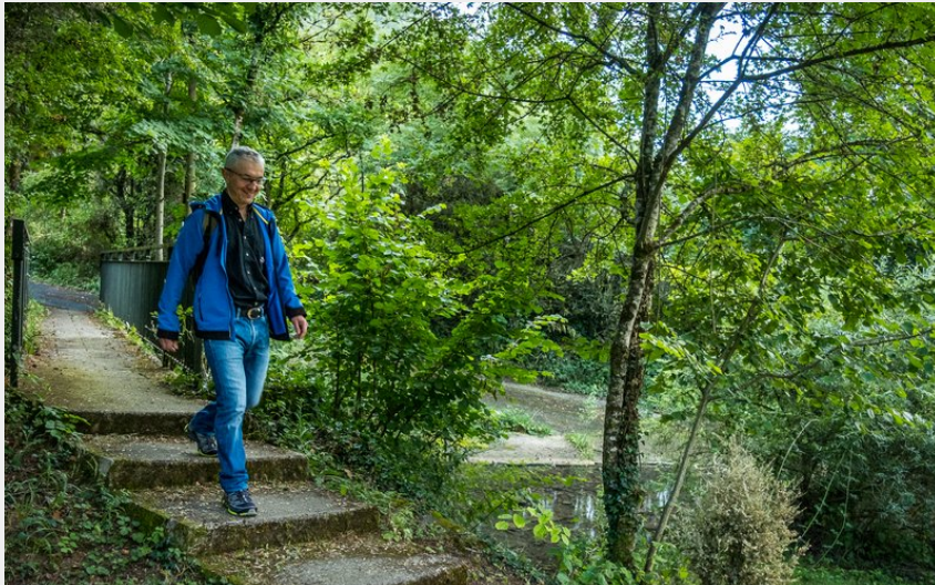
Le ruisseau du Verzolet