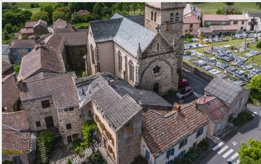
Vue sur le village de Martrin (Virginie Govignon)