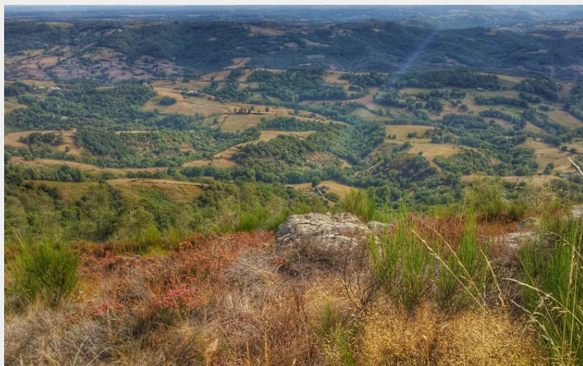
Panorama depuis le puech du Kaymar (Candie Durand)