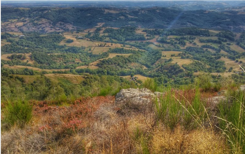
Panorama depuis le puech du Kaymar (Candie Durand)