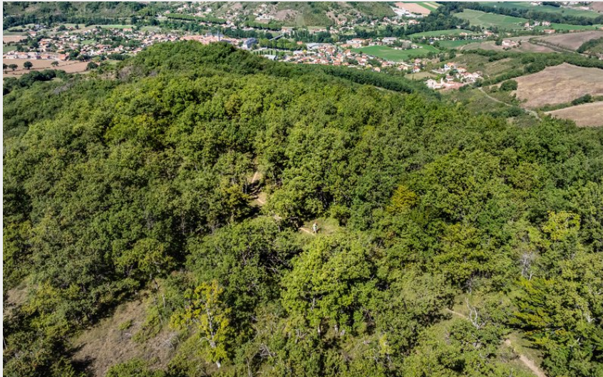
Plongée vers Vabres l'Abbaye (Virginie Govignon)