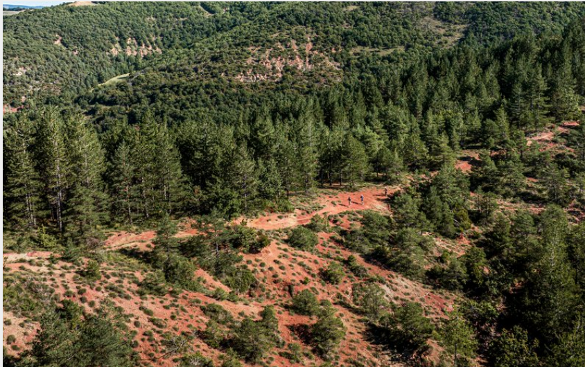
Le Rougeiras (Fest'Trail Causses & Rougier - Xavier Waerzeguers)