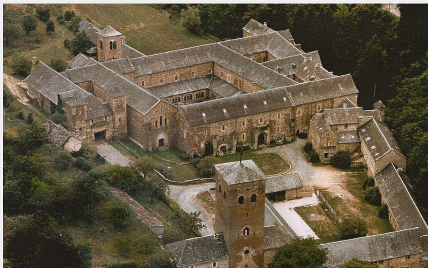
Abbaye de Bonnecombe