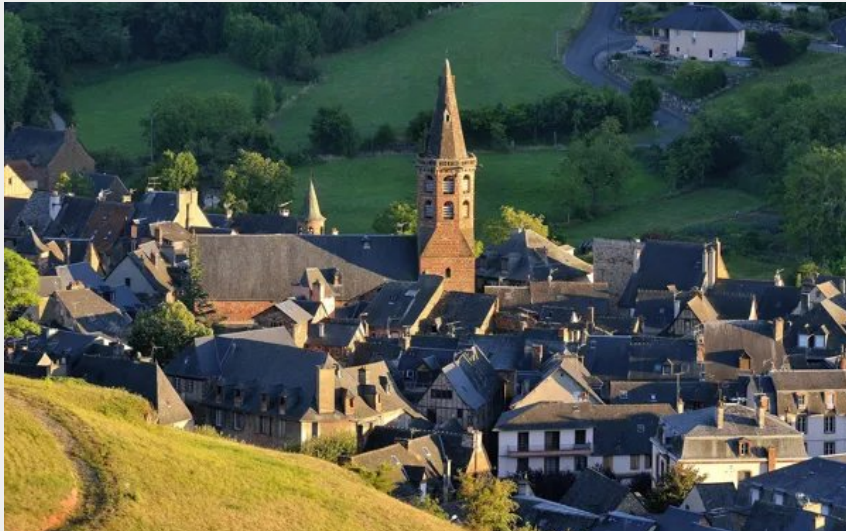
Point de vue sur Marcillac depuis le parcours Terra Trail n°3